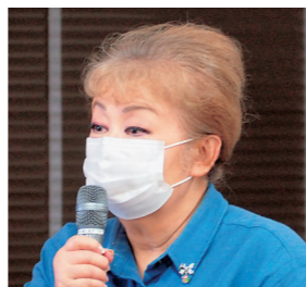
葦合北支部の報告をする プラトリイ支部長

また、六甲アイランド支部 からは、コロナ自粛のもとで も、認知症予防の脳トレ用紙