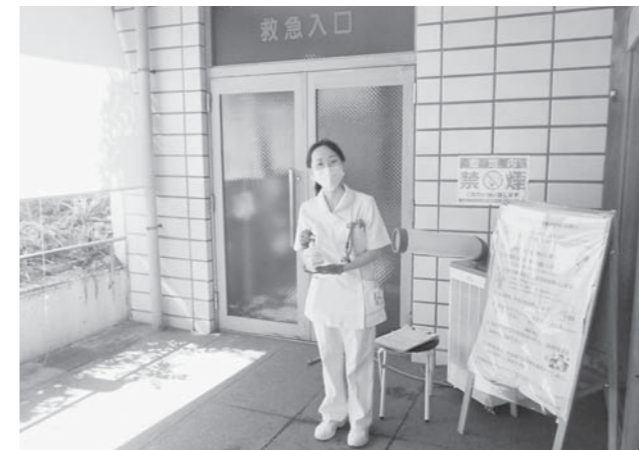
病院玄関で「お熱はありませんか？」とお声かけさせていただいています。ご協力ください！

3月9日の開設時から9月末までで、「風邪・発熱外来」にはのべ583の方が受診されました。今後も安心して受診していただくために以下のことをご協力お願いいたします。