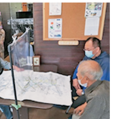
地図に落とし配達者のルートを 検討中

ます」と嬉しいお言葉をいただき ました。 「魚崎せせらぎの会」は、認知 症予防を目的とした班会です。奇 数月の第1金曜日13時半から開催 です。参加お待ちしております。 (北林)